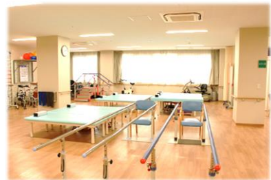
〇リハビリテーション室