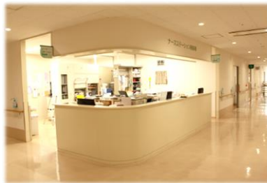
〇スタッフステーション